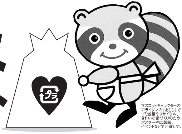
マスコットキャラクターの アライグマの「あらら」です。 ゴミ減量やリサイクル、 きれいな街づくりのため、 ポスターや広報紙、 イベントなどで活躍しています。