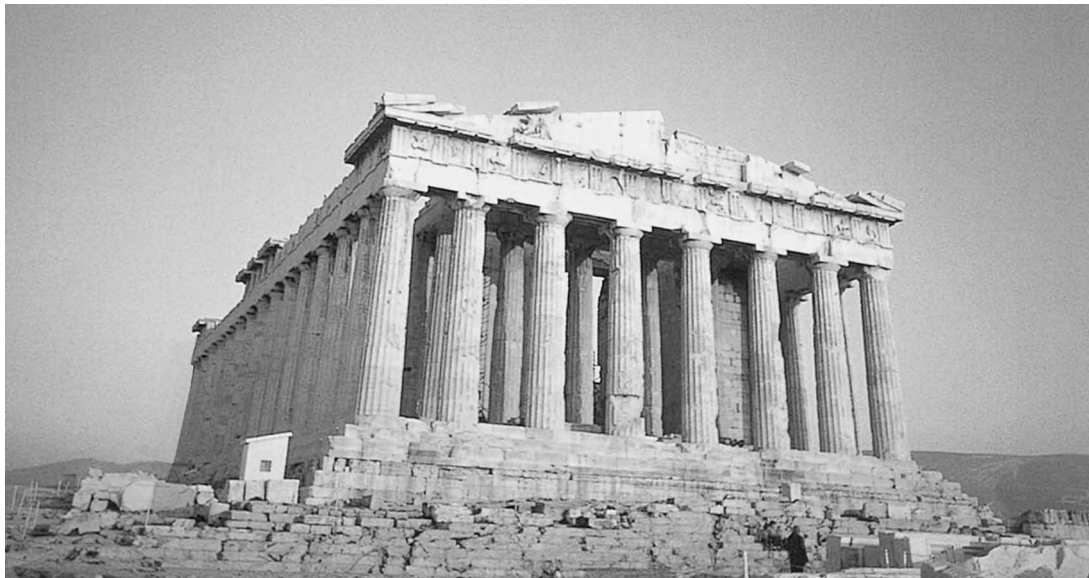
ギリシャ・アテネの象徴 アクアポリスの丘にそびえる世界遺産バルテノン神殿

「お金さえ出しておけば何とかなる」というわが国の立場は湾岸戦争以降、国際社会のなかで非常に厳しい状況に置かれて、国際貢献のあり方が問われています。したがって今回、苦渋の決断をしなければなら