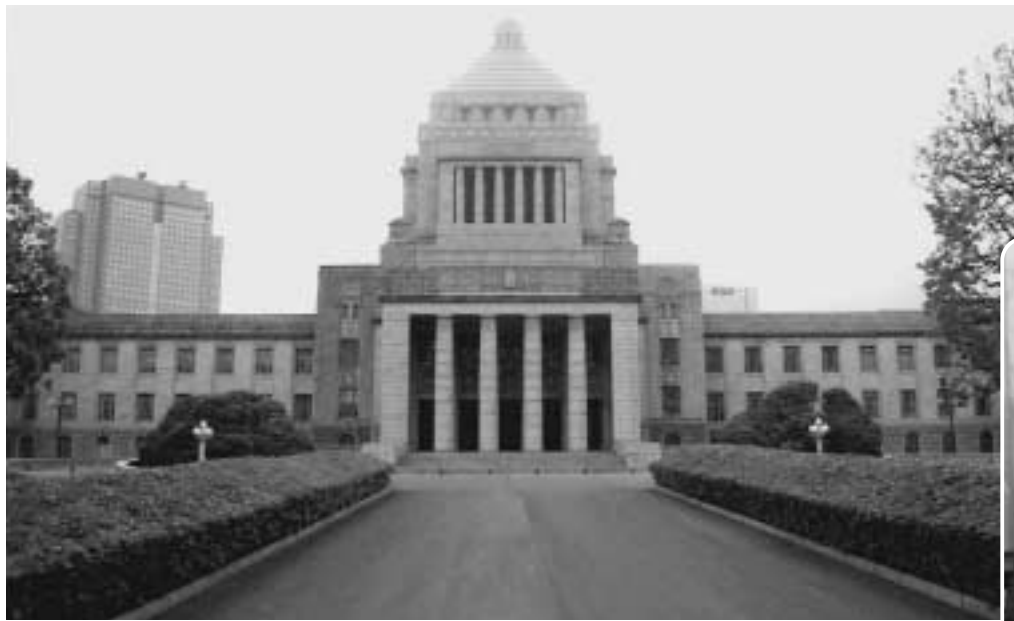
小泉改革の総仕上げには是非とも年金改革を!!

中でも第286号議案「指定都市高速道路の整備計画の変更に係る同意について」は自ら議案質疑に立ちその内容を質しました。